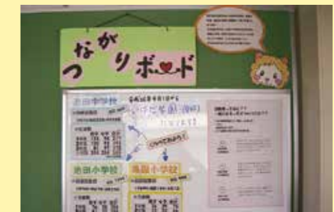
▲ 池田中学校のつながりボード