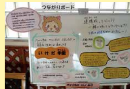
▲ 呉服小学校のつながりボード

池田中学校区では、それぞれの学校に、各学校だよりやMTP通信を貼る掲示板と各校の行事や様子、子ども、先生等を紹介し、子どもがつながっていけるような「つながりボード」を設置しています。池田中学校区は連携型の小中一貫校になりますので、このコーナーを通してそれぞれの学校を身近に感じて欲しいと思います。