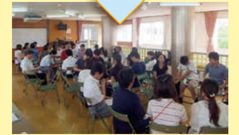
授業後に合同で検討会