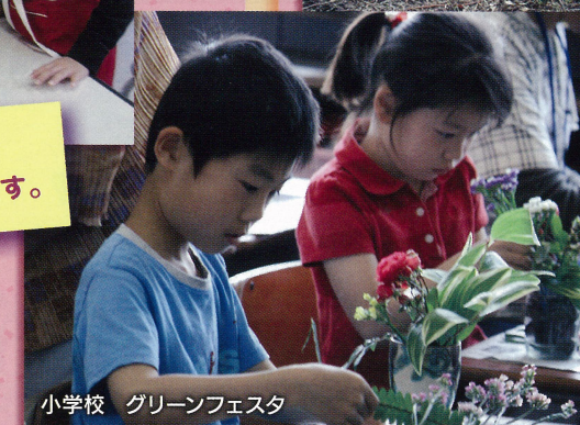
小学校 グリーンフェスタ