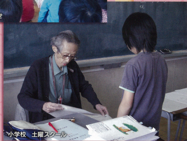
小学校 土曜スクール