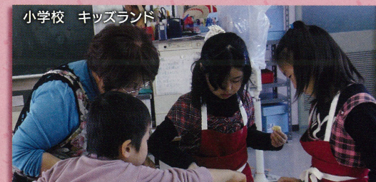
小学校 キッズランド

市内の全小学校で実施しているキッズランドや、学校園で行われるイベント・地域の行事などを通して、地域の大人が子どもと知り合う機会づくりに取り組んでいます。