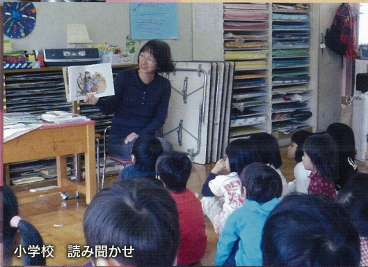
小学校 読み聞かせ

『できた!』『わかった!』と言ってくれたとき、「ああ、やっていてよかった」と思います。緊張気味だった子どもたちが気軽に呼び止めてくれるようになるので嬉しいです。