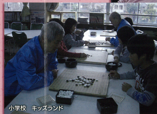
小学校 キッズランド