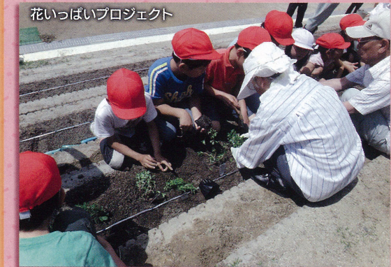
花いっぱいプロジェクト