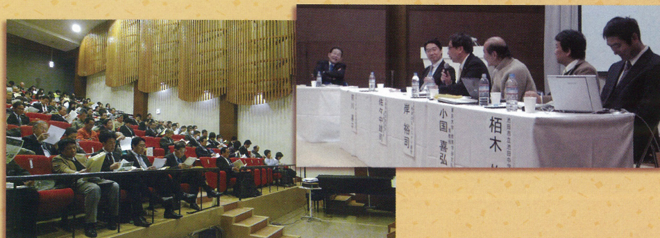
(平成24年2月26日 in 池田市立くれは音楽堂)

本市におきましては、各中学校区で子どもたちの学習支援、安全見守り活動、環境整備、ふれあい活動など多彩な活動が展開されています。今後も池田市の子どもたちのよりよい育ちのために、保護者や地域の方々が、日々、学校園に関わることができるような仕組みづくりと、学校が地域づくりの拠点となるような取り組みを進めてまいります。