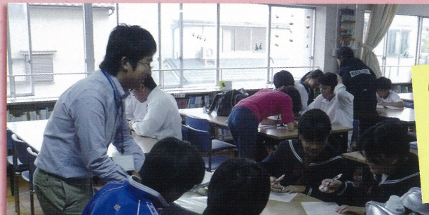
中学校 放課後学習

学習活動でのゲストティーチャーやクラブ活動のコーチとして、子どもの学力・体力の育成に取り組んでいます。