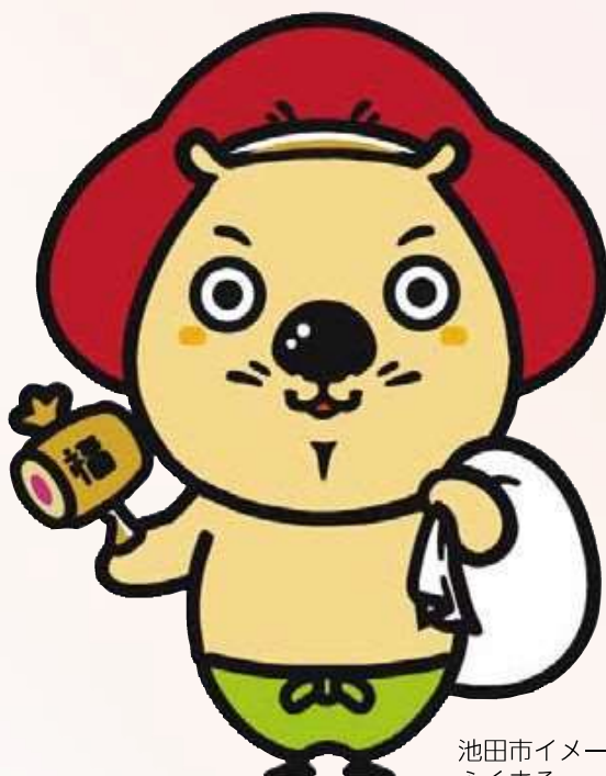
池田市イメージキャラクター ふくまる