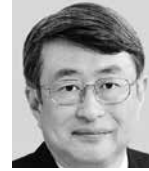
やまもと たけし 山元 建 (日本共産党)