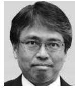
ふじもと まさひろ 藤本 昌宏 (公明党)