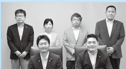
市議会だより編集特別委員会

市議会だより編集特別委員会も新たなメンバー構成となり、より分かりやすい紙面づくりに取り組んでまいりますので、今後も御愛読くださいますよう、お願い申し上げます。