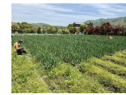
4月 1 m くらいになり、玉ねぎの部分が丸くなってきました！