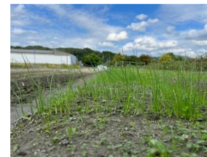
10月下旬 グングン伸び、ネギのようです。