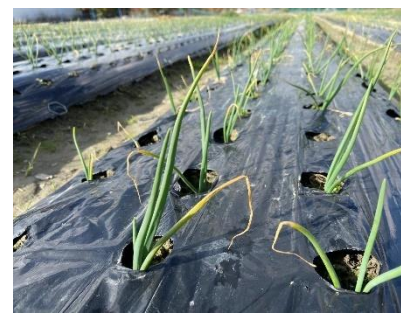
12月～令和5年 3月 「追肥」肥料を3回与えます。 「除草」草抜きをします。