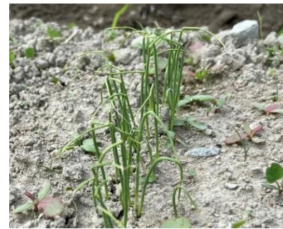
10月上旬 芽が出ています。