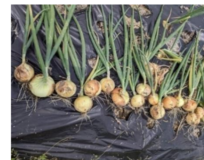
6月「収穫」 葉が倒れたら 収穫の合図です。