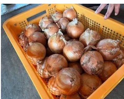
「乾燥」 葉を切って 乾燥させます。