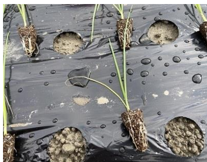
11月「定植」 苗が大きくなったので 植え替えを行います。