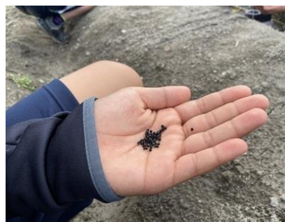
令和4年 9月 「種まき」