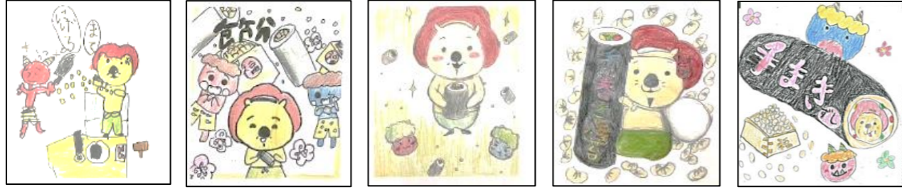
さくら幼稚園 北豊島小学校 呉服小学校 石橋南小学校 緑丘小学校