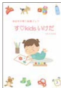
親子で安心して遊べる場所を紹介