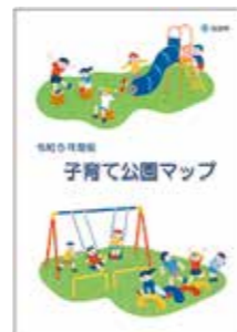
池田市内の公園を紹介