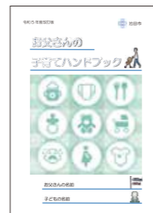
お父さんの育児のための入門書