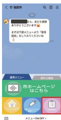
① めい メニュー おん をON しよしん にして受信 せってい 設定 えら を選びます。