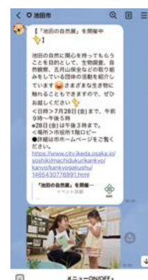
③ ひつよう 必要な じやうほう 情報 らいん だけLINE とど が届きます。