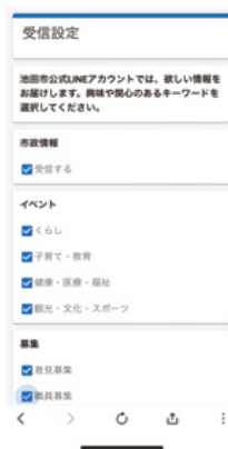
② ひつよう 必要な じやうほう 情報 えら を選びます。