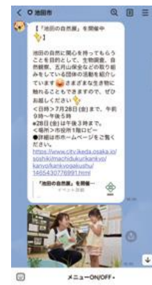
③ Chỉ thông tin bạn cần mới được gửi tới LINE