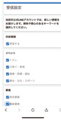
② Chọn thông tin bạn cần