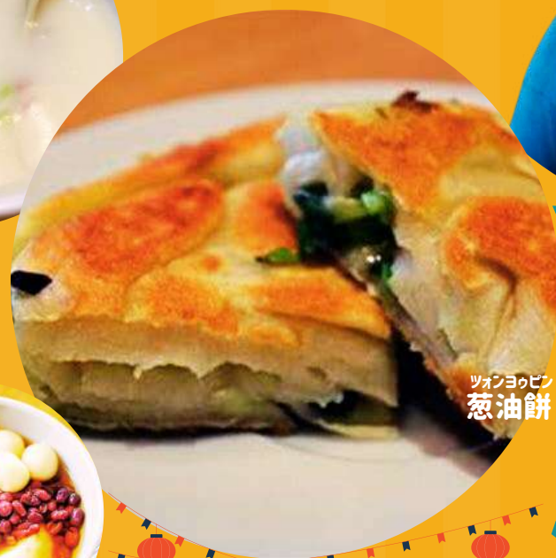
ツォンヨロピン 葱油餅