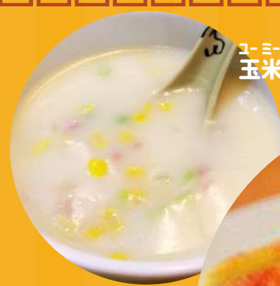
ユミ-ンタン 玉米濃湯