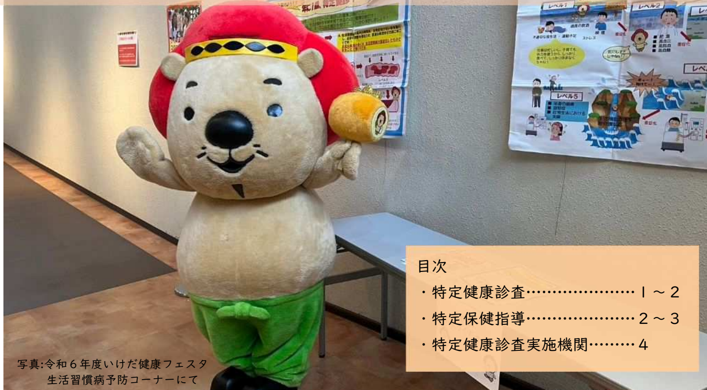
写真:令和6年度いけだ健康フェスタ 生活習慣病予防コーナーにて