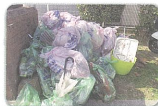
リヤカー4台分のゴミ取得