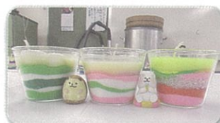
カラフルな色彩で芸術的な 作品ができました。