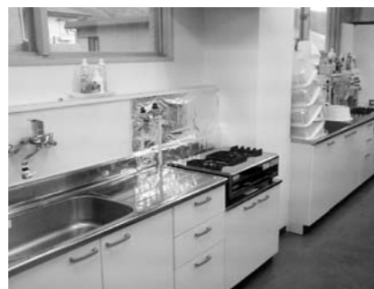
シンク、調理台が使いやすいになりました！