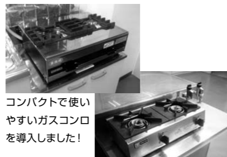
コンパクトで使いやすいガスコンロを導入しました！