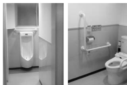
バリアフリー対応も充実しました！