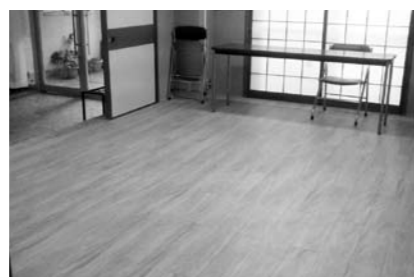
フローリング化で幅広い用途に使えます！