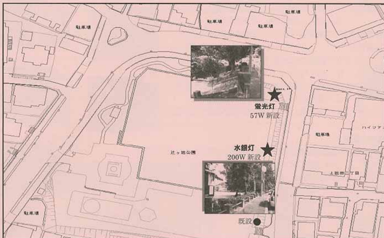
街路灯設置予定箇所(有・無⇒ポール)