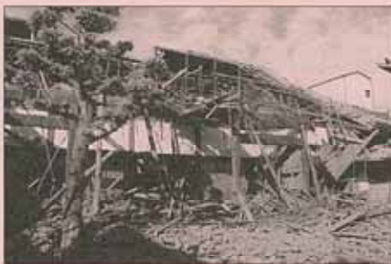
池田小学校区で 全壊した寺院

平成7年1月に発生した阪神・淡路大震災では、家屋の倒壊による生き埋めや建物などに閉じ込められた人のうち、90%以上は自力または家族や隣人に救助され、消防などの公的機関に助けられたのは、2%にも満たなかったというデータがあります。