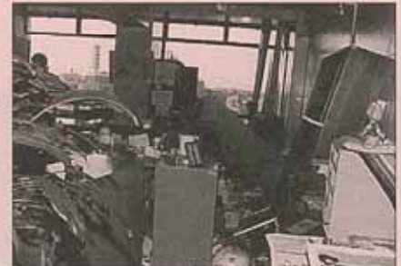
市庁舎 備品が散乱した

防災対策の基本は、住民一人一人が自分の命は自分で守る「自助」、地域住民が連携してまちの安全をみんなで守る「共助」、行政が災害に強い地域の基盤整備を進める「公助」の3つであると言われていいます。これらがうまく連携することで、防災対策は効果を最大に発揮することができます。自主防災組織はこの共助に当たります。