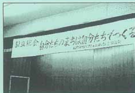
【石橋南コミュニティ推進協議会設立総会】

ここ石橋南小学校区においても、標題の協議会を設立し、皆さんが納められた税金のうち 625 万円（予算提案額）を地域の課題解決などのために有効活用できるよう、平成 20 年度の実施に向けて、市に対する事業提案について協議を重ねてまいりました。