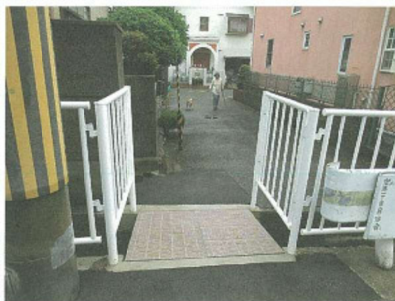
(農業用水路上に設置)

石橋南校区空港1丁目の農業用水路上の簡易通路の鉄板を排去して、クレーチングを設置保管、住民(こども等)の通行安全を図る事業として実施。