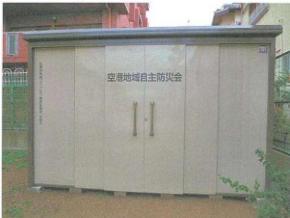
(空港会館敷地に施設)

石橋南校区の空港地域の安心・安全活動のため、防災資材(倉庫、テント等も含む)購入配置、体制強化、環境整備を実施。