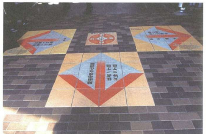
(阪急石橋西出口前道路)

「いらっしゃいませ、ようこそ石橋へ」石橋西口を利用し、石橋西地区への来訪者に「どっち、あっち、こっち」地名、方向をわかりやすくし、活性化と安心なまちづくりの一端とする。完成して住民、まちへの来訪者に大好評。