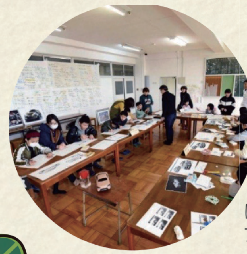
はぐのさとプロジェクト