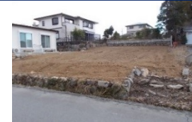
三重県津市(土地) 譲渡額約270万円