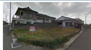
鹿児島県いちき串木野市(土地) 譲渡額約350万円