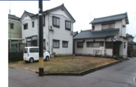
新潟県燕市(土地) 譲渡額約350万円