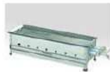
とうもろこし焼き機