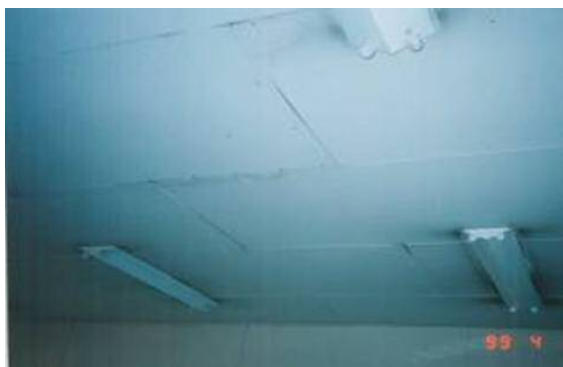
天井のスレート板

問合せ先 池田市環境部広域環境保全課 （池田市環境部環境政策課内） 直通：072-754-6647 代表：072-752-1111（内線465）