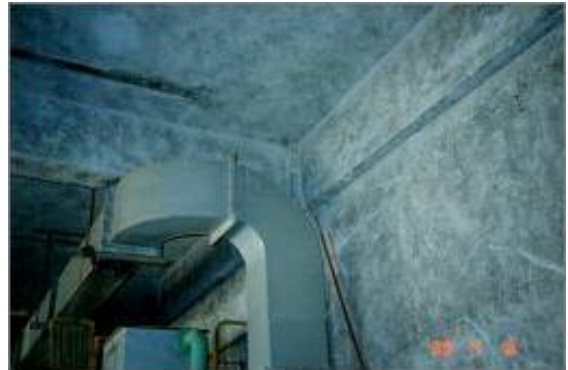
機械室の壁・天井の断熱