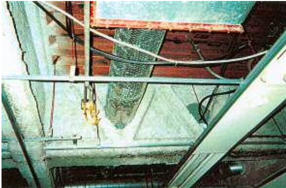
鉄骨造の梁・柱の耐火被覆